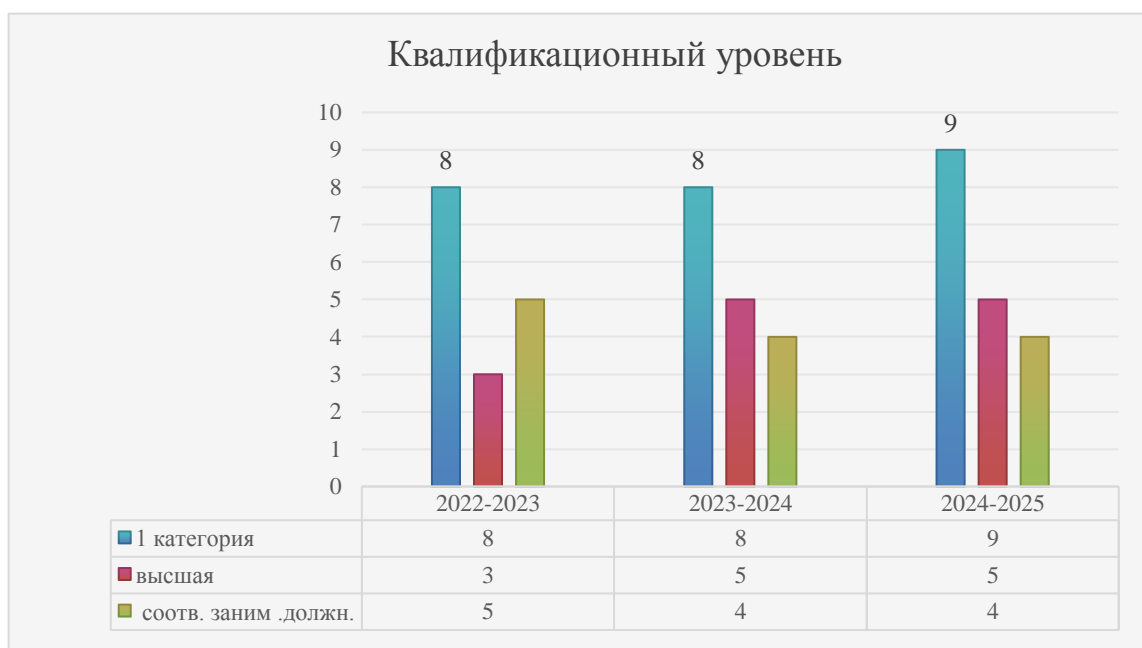
Диаграмма №1. Квалификационный уровень педагогических работников

Диаграмма№1 показывает данные по уровню квалификации педагогических работников Центра в разрезе 3х лет: 5 педагогов Центра имеют высшую квалификационную категорию , 9 педагогов – первую , 4 педагогов аттестованы на соответствие занимаемой должности. В целом -14 педагогических работников (77%) имеют квалификационные категории, что позволяет сказать, что состав педагогических работников Центра обладает достаточным уровнем компетенций для решения учебно-воспитательных задач.